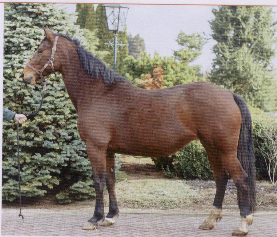
Stermerrie Reveil VB werd al preferent op haar eerste drie nakomelingen, Vivaldo was haar eerste.